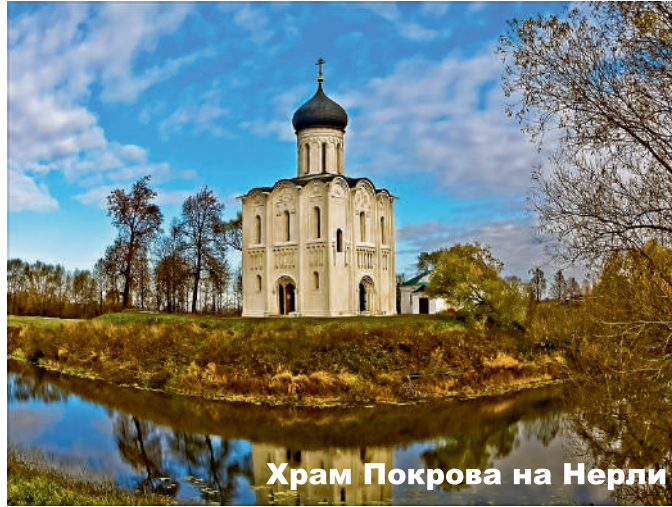
Храм Покрова на Нерли

Когда, воздевая руки к Богу, всю ночь мы просили у Него помилования, возложив на Него все свои надежды, тогда избавились от несчастья, тогда сподобились отмены окружавших нас бедствий. Тогда мы увидели рассеяние грозы и узрели отступление гнева Господня от нас. Ибо мы