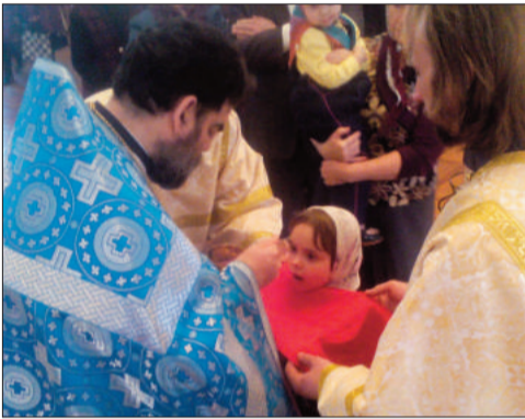
Тихвинская церковь, г. Гагарин