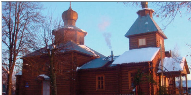
Храм свв. равноап. Кирилла и Мефодия, п. Угра Угранский район