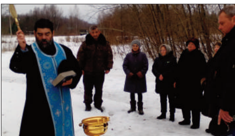
Часовня Сретения Господня, д. Долгое, Гагаринский район