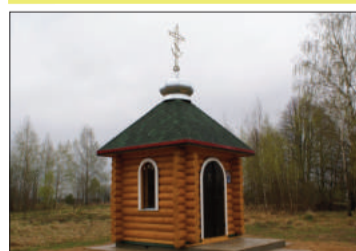
Часовня в честь апостола и еван- гелиста Иоанна Богослова д. Марфино, Угранский район