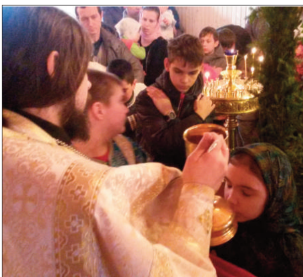
Храм иконы Божией Матери "Всех Скорбящих Радость", с. Карманово, Гагаринский район