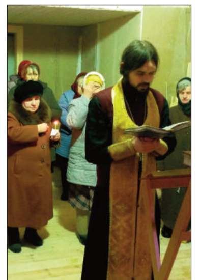
Часовня, д. Ельня, Гагаринский район