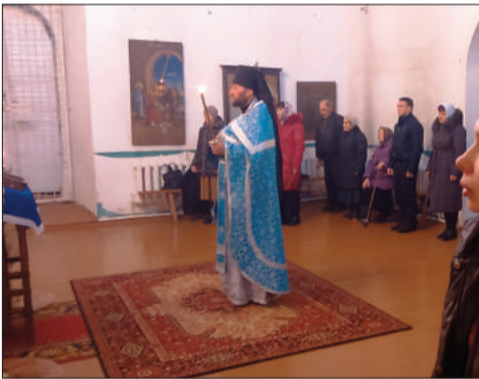
Преображенская церковь, с. Баскаково, Гагаринский район