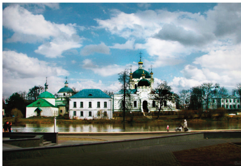
Соборный комплекс: Благовещенский Собор, Тихвинская церковь, Церковь иконы Божией Матери «Всех скорбящих Радость», г. Гагарин

Газета содержит священные изображения. Просьба не использовать в хозяйственных целях