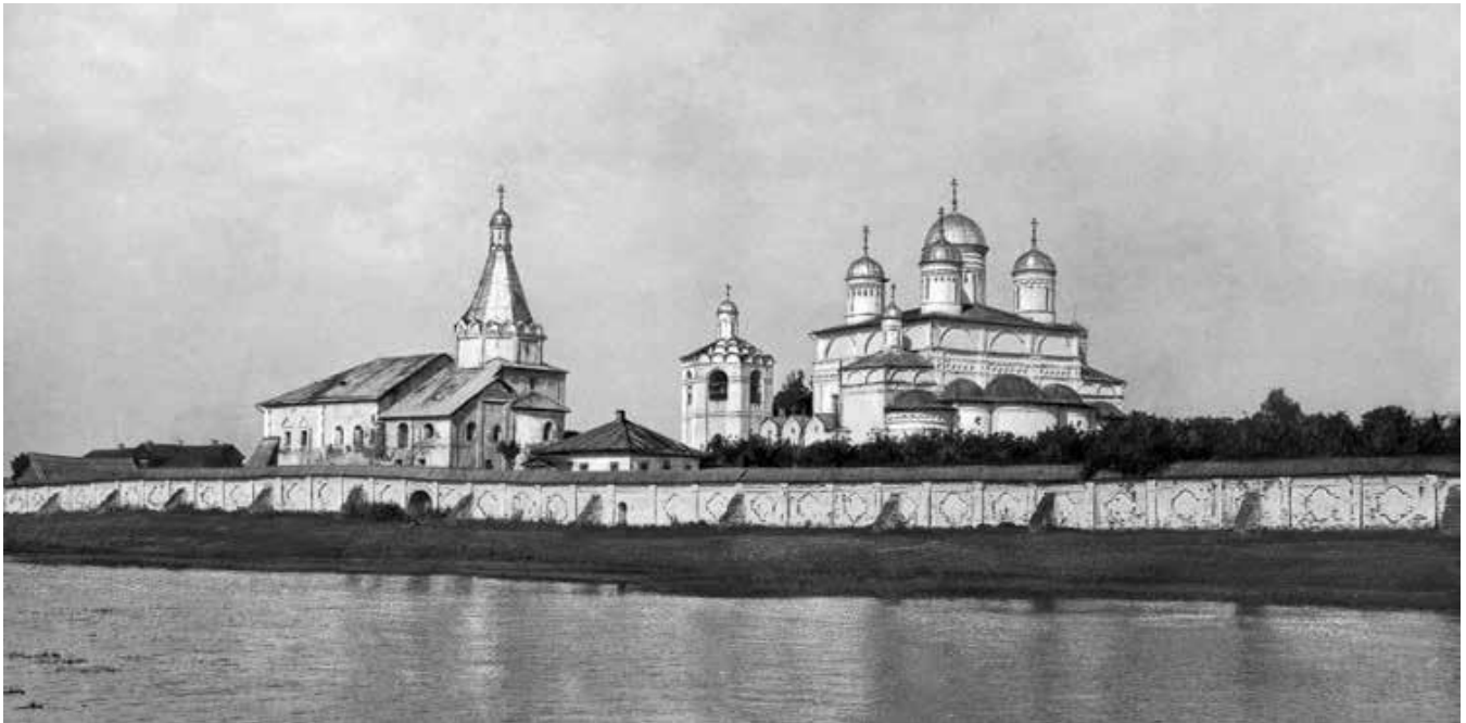
Вид на монастырь перед его закрытием. 1929 г.

стекалось в Болдино на ярмарки, проходившие по престольным праздникам — на Троицын день летом и на Введение во храм Пресвятой Богородицы зимой.