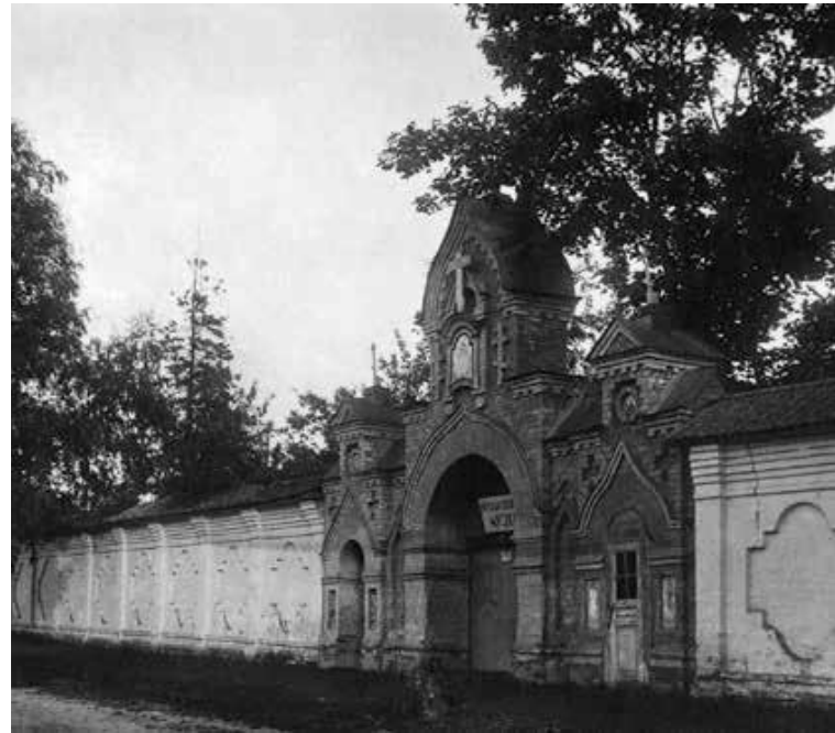
Братия монастыря с игуменом Антонием. 1994 г. Святые врата монастыря. 1929 г.

славился монастырь, но самое главное, в стенах монастыря возродилась духовная жизнь.