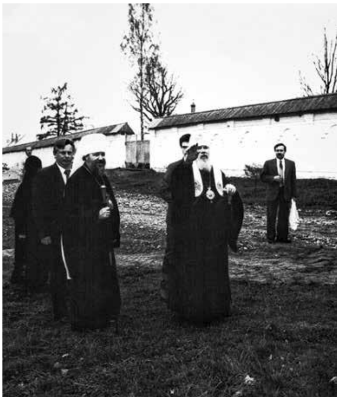
Посещение Свято-Троицкого Болдина мужского монастыря Патриархом Алексием II 3 мая 1993 г. (вверху)